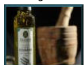
Olio e aceto